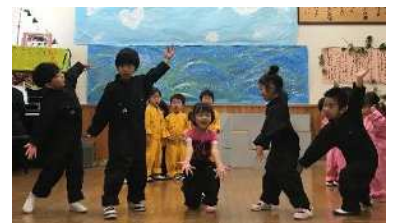
ハッピートラベル～♪