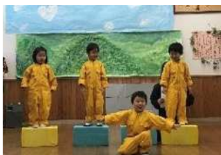
海を守るCレンジャー参上！