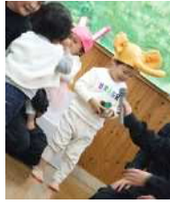
☆マイクで自己紹介☆