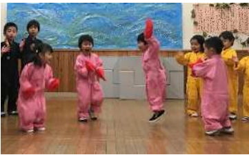
エビカニックスでおどちゃおう。