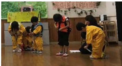
ライフジャケット自分で着れるかなミッション★