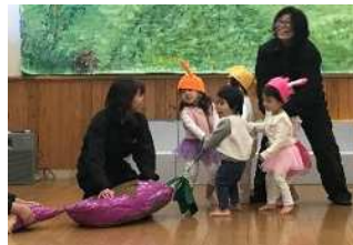
うんとこしょ、どっこいしょ