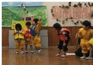
やった～ミッションクリア！