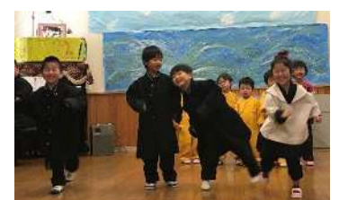
♪つっぱりことが男の～♪