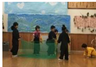
ちがうよこっちの編みだよ。