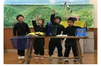
みんなで冒険に出発だ～