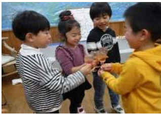
☆シャンメリーゼリーで乾杯