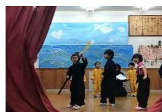
ピッピ、ワッショイ