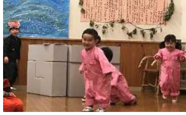
ちがうよ、ちがうよ、おおかみだ。