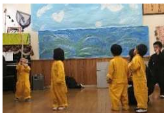
この網で魚を獲ろう！