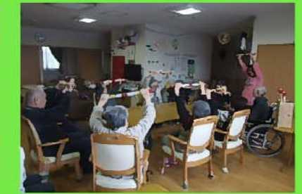
みんなでストレッチ レクリエーション前の準備体操は念入りに