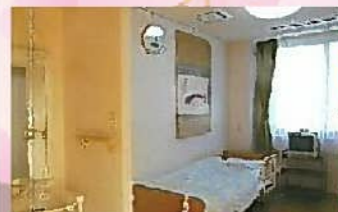
洋室 好みに合わせた生活環境を提供致します