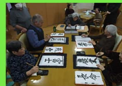
趣味活動 難しい漢字にも挑戦です