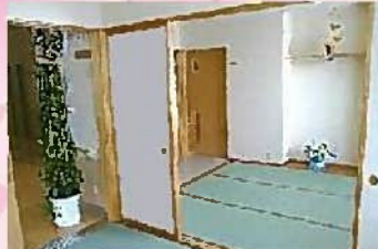
和室 襖を開けると大きな空間になります