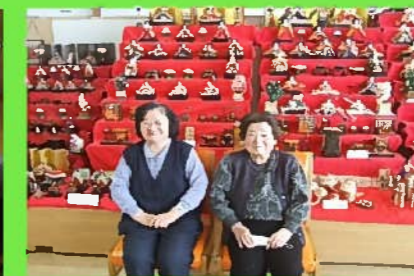
季節行事 外出で気分をリフレッシュ