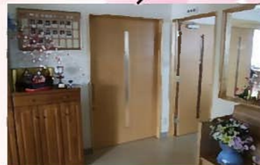
玄関 季節の装飾でお出迎えいたします